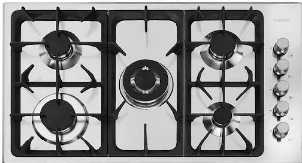
Table de cuisson Professionale