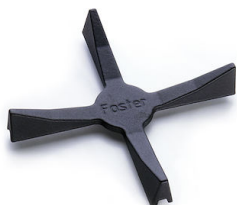
Support de Wok en fonte